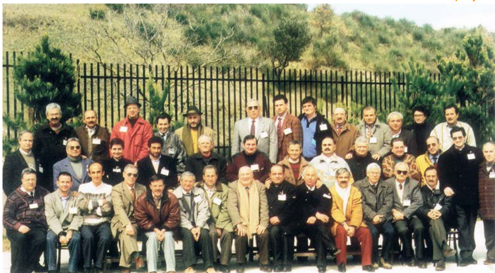
1° CURSILLO UOMINI - CAMPOLI DEL MONTE TABURNO 23-26 MARZO 1995

piacere ricevere una telefonata. Meglio se il giorno del compleanno. La data potrà essere cercata sul quadrante che accompagnava la foto o con l'aiuto della rubrica che segue, che, bimestre per bimestre, avremo cura di pubblicare.