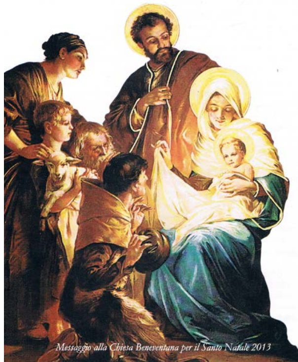
Messaggio alla Chiesa Beneventana per il Santo Natale 2013