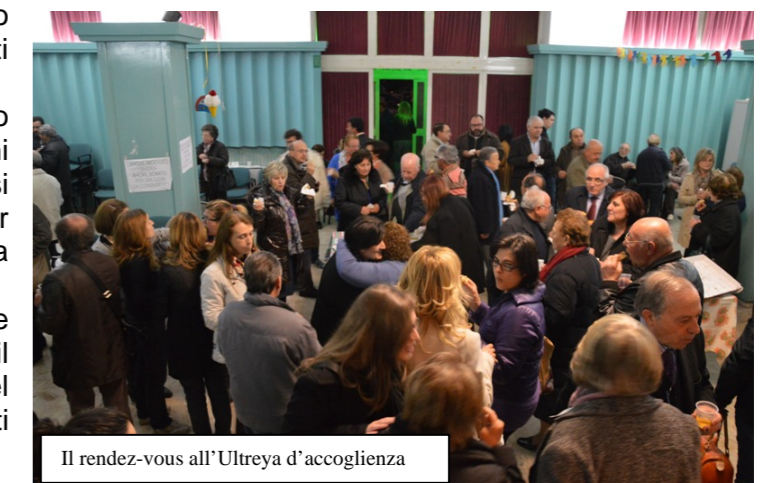
Il rendez-vous all'Ultreya d'accoglienza