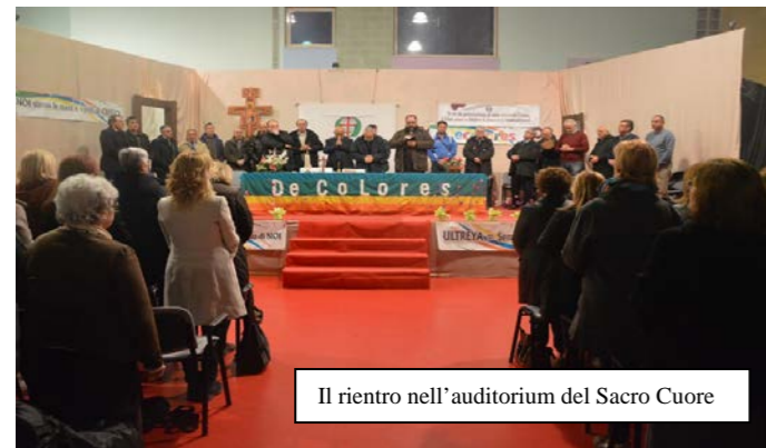
Il rientro nell'auditorium del Sacro Cuore