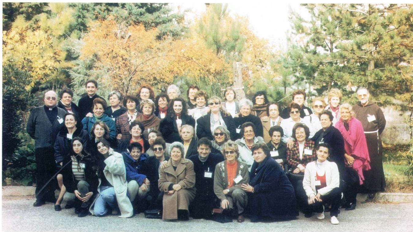
2° CURSILLO DONNE - LACEDONIA 7-10 NOVEMBRE 1996