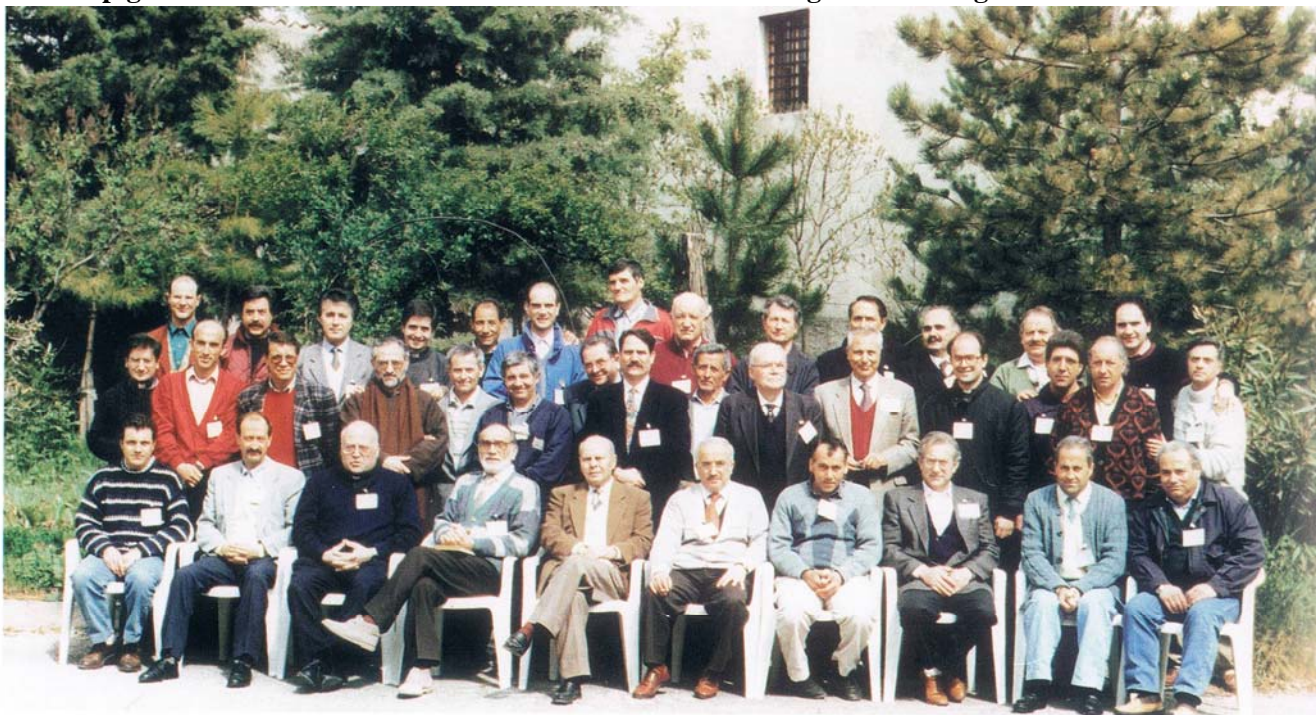
2° CURSILLO UOMINI - LACEDONIA 25-28 APRILE 1996

A memoria dei partecipanti pubblichiamo le foto del "2° corso uomini" e "2° corso donne" tenuti a Lacedonia nel 1996, nella speranza che il ricordo faccia rinascere la voglia di vivere il "quarto giorno" non da pigri cattolici abitudinari ma di vivaci ed entusiasti evangelizzatori degli ambienti.