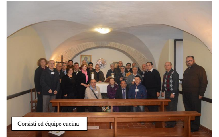
Corsisti ed équipe cucina

Carissimi amici e fratelli in Cristo, avete ora il cuore traboccante di un FUOCO VIVO con il quale vorreste "ardere il mondo". Fate in modo che non sia di "paglia", ma che, nel tempo, dia calore e colore alla vostra vita, che vi circondi e porti conforto a coloro che ne avranno bisogno. Auguri!