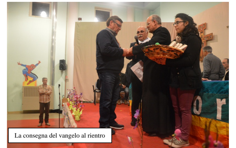
La consegna del vangelo al rientro