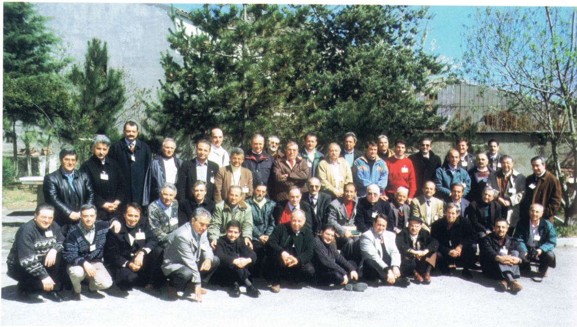
3° CURSILLO UOMINI - LACEDONIA 24-27 APRILE 1997

Nel 1997 a Lacedonia ho partecipato anch'io al 3° Cursillo della diocesi di Benevento. A distanza di oltre tre lustri mi chiedo: "Cosa è rimasto dei quei giorni? Ho mantenuto fede alle promesse fatte a Cristo? Ho conservato qualcuna delle amicizie fatte durante i tre stupendi giorni?". Vale la pena forse rifare il film della mia vita e correggere quanto è possibile ancora correggere.