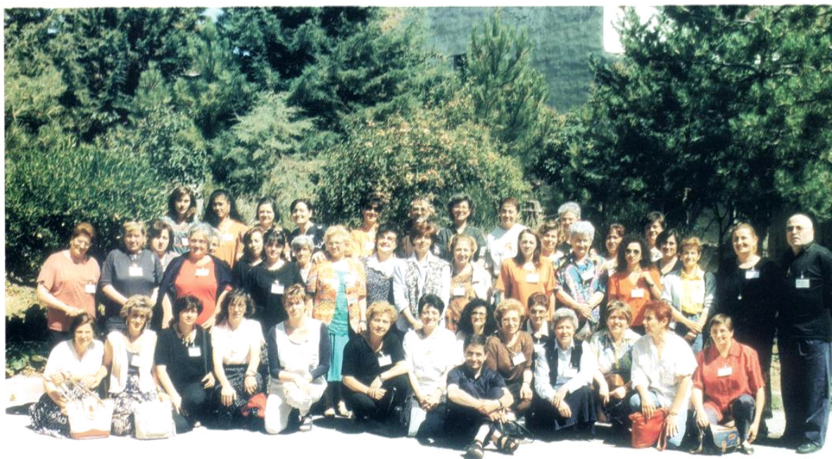
3° CURSILLO DONNE - LACEDONIA 10-13 NOVEMBRE 1997