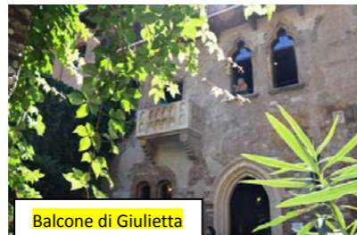
Balcone di Giulietta

Altrettanto indimenticabili rimangono i momenti di spiritualità riservati al viaggio: recita mattutina delle lodi, celebrazione quotidiana della Santa Messa, Rosario negli spostamenti in pullman e Ultreya con i fratelli del Territorio. Tra le celebrazioni eucaristiche,