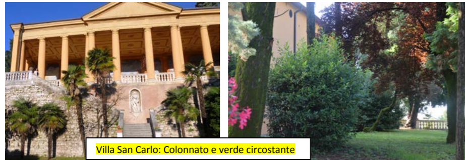
Villa San Carlo: Colonnato e verde circostante

Visitati luoghi ricchi di arte e religiosità – Ultreya gioiosa con i fratelli del Territorio 7