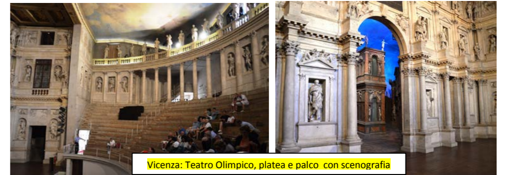
Vicenza: Teatro Olimpico, platea e palco con scenografia