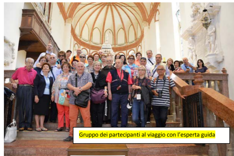
Gruppo dei partecipanti al viaggio con l'esperta guida