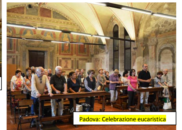
Padova: Celebrazione eucaristica