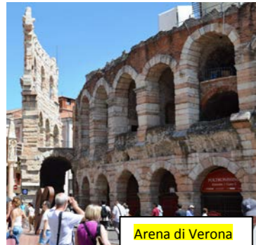
Arena di Verona