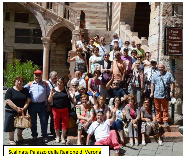
Scalinata Palazzo della Ragione di Verona