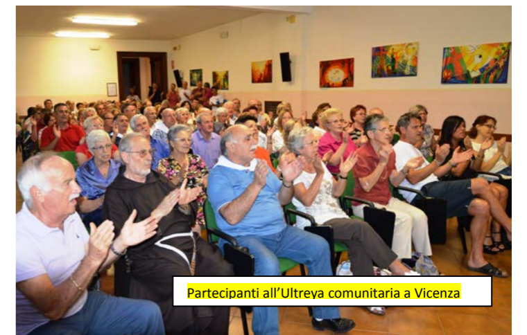
Partecipanti all'Ultreya comunitaria a Vicenza

ha esposto il tormento che prova di fronte alle miserie del mondo d'oggi: prostituzione principalmente. Che pena dover arrestare extracomunitarie che, venute in Italia con la speranza di trovare un lavoro, per necessità, in anguste camere, dove spesso risaltano altarini con Madonna e santi, sono costrette a prostituirsi. Nessuna pietà, invece, per gli spacciatori di droga, ma tanto tormento quando a genitori ignari di avere figli drogati bisogna dare notizia del loro arresto.