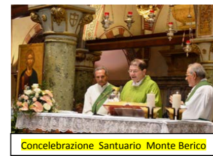
Concelebrazione Santuario Monte Berico