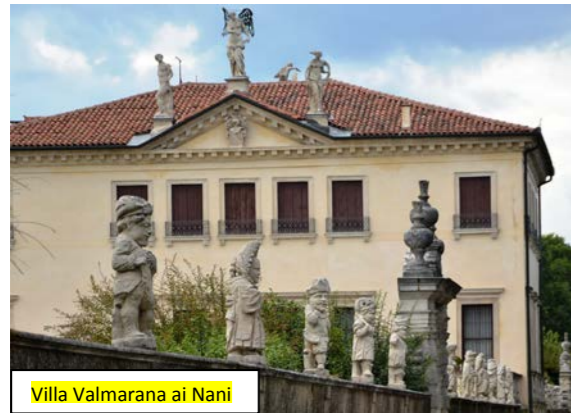
Villa Valmarana ai Nani

Per descrivere anche sommariamente le opere d'arte ammirate nelle quattro città visitate: Vicenza, Padova, Verona e Mantova non basterebbe un intero numero del nostro Notiziario. Qualche foto scattata qua e là darà un'idea della immensa ricchezza artistica che la nostra nazione possiede ma non potrà mai esprimere le emozioni provate davanti ad affreschi e tele di Giotto, Tiepolo, Mantegna... e tanti altri artisti che il mondo intero ci invidia. Una vera opera d'arte può essere ritenuta già la villa nella quale abbiamo soggiornato, dove nuovo e antico si mescolano in una struttura immensa immersa in diecimila metri quadri di verde molto curato: stanze senza grandi pretese, dotate dell'essenziale, ma distribuite lungo immensi corridoi nei quali si alternano sale con mobili antichi di alto pregio, affreschi e un colonnato, con pareti interne interamente affrescate, che affaccia su un laghetto nel quale guazzano oche e cigni. Una chicca: tra gli alberi che circondano la villa vi è un cedro del Libano importato dall'Asia oltre 400 anni fa.