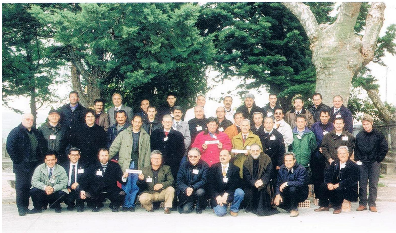
4° CURSILLO UOMINI - CERCEMAGGIORE 23-26 APRILE 1998

Rivedere la foto scattata 16 anni fa mi ha procurato una duplice tristezza: tristezza per chi non c'è più, tristezza per quanti, responsabili compresi, non si fanno più vedere in Ultreya dove ci hanno insegnato che è possibile ricaricare le batterie per portare avanti l'impegno assunto col Signore di evangelizzare gli ambienti nei quali viviamo.