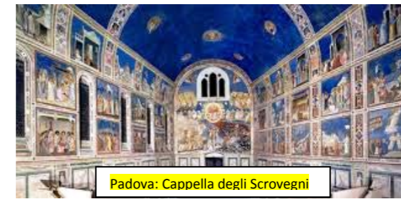
Padova: Cappella degli Scrovegni

Molto bella l'Ultreya, iniziata con la riunione di gruppo e terminata davanti al Santissimo. Brillante la conduzione del giovane rettore, che all'ultimo momento ha sostituito il designato colto da attacco febbrile, e significativi entrambi i rolli sul tema "Cristiano sul lavoro" tenuti da un fratello di Vicenza e uno di Benevento. Straniero, emigrato anni fa dalla Colombia, il primo, con il suo comportamento è riuscito a farsi apprezzare per pacatezza e serenità sul posto di