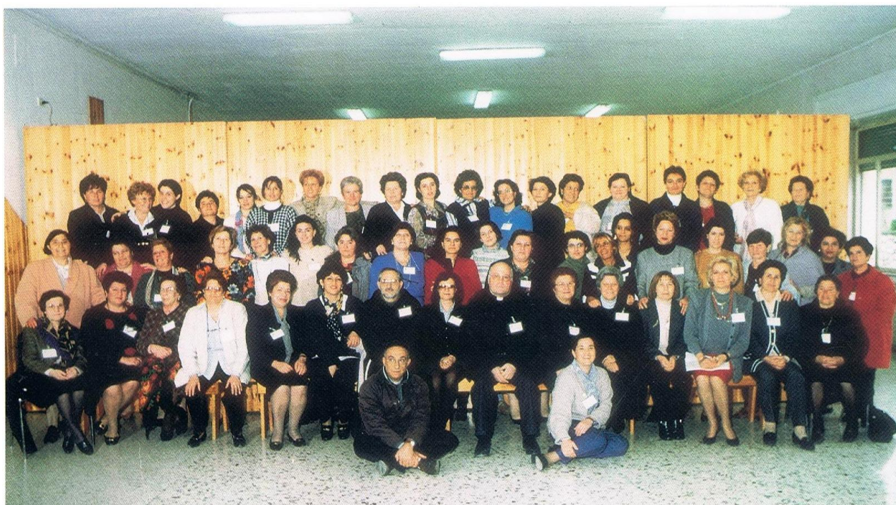
4° CURSILLO DONNE - S. MARIA A VICO 12-15 NOVEMBRE 1998