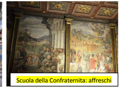
Scuola della Confraternita: affreschi