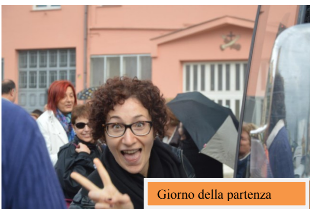
Giorno della partenza