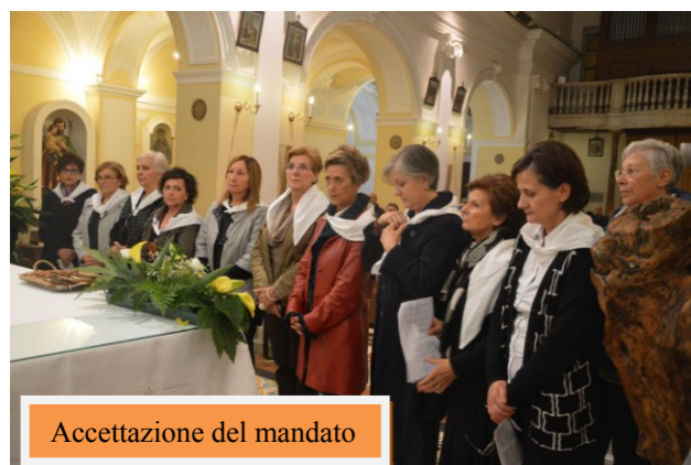
Accettazione del mandato