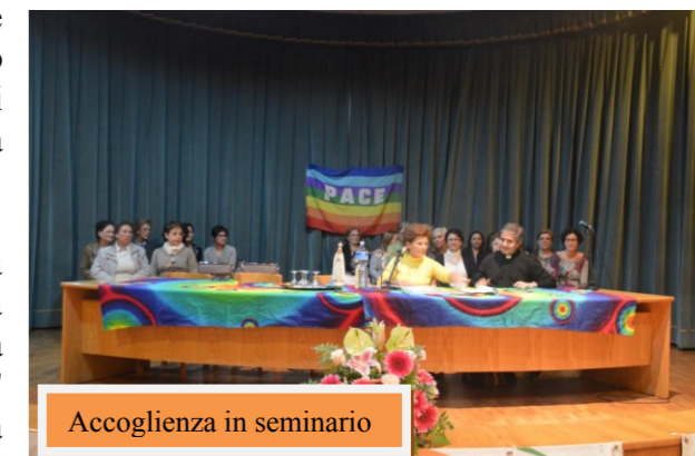
Accoglienza in seminario