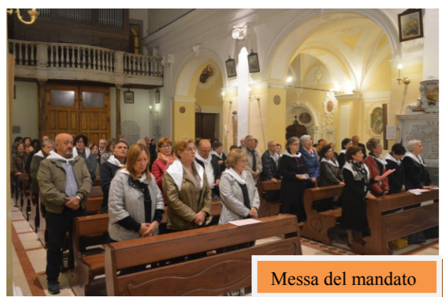
Messa del mandato