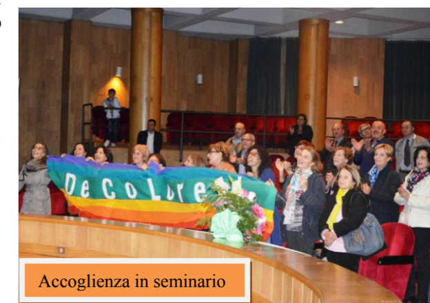
Accoglienza in seminario