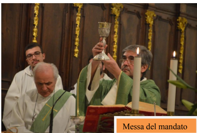
Messa del mandato