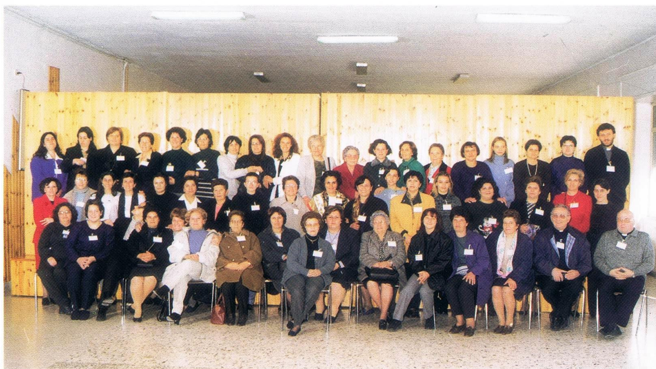
5° CURSILLO DONNE - S. MARIA A VICO 11-14 NOVEMBRE 1999