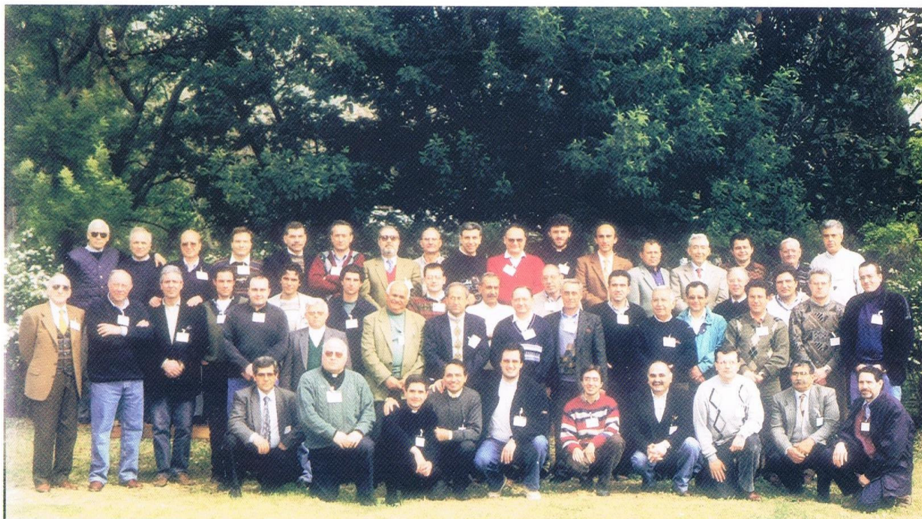
5° CURSILLO UOMINI - S. MARIA A VICO 22-25 APRILE 1999

Quanto eravamo giovani! Gli anni anagrafici non si possono fermare, ma la giovinezza e l'ardore spirituale possono restare immutati nel tempo, così come l'amicizia può rimanere eterna. Mi domando e domando ai compagni di cordata: "Cosa è rimasto di tutto il vissuto di quel lontano 1999?".