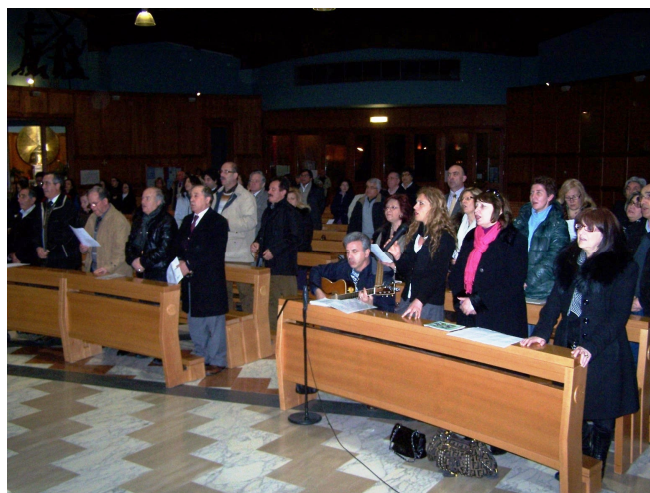
Chiesa S. Maria della Pace Sabato 19 marzo – Messa del “Mandato”: Celebranti – Fedeli in preghiera – Offertorio - Équipe laica