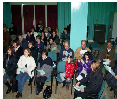
Piazzale P. Pio Giovedì 24 marzo: Raduno e saluto alla partenza – Adorazione eucaristica