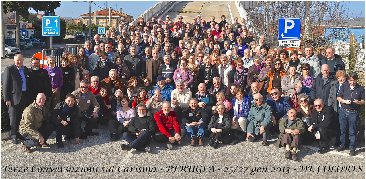
Terze Conversazioni sul Carisma - PERUGIA - 25/27 gen 2013 - DE COLORES