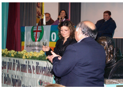
Sala "P. Pio" Mercoledì 20 ottobre, Ultreya d'accoglienza: