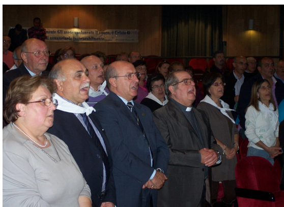
Auditorium Giovanni Paolo II Domenica 17 ottobre: Accoglienza festosa presenti animatore e coordinatore territoriali