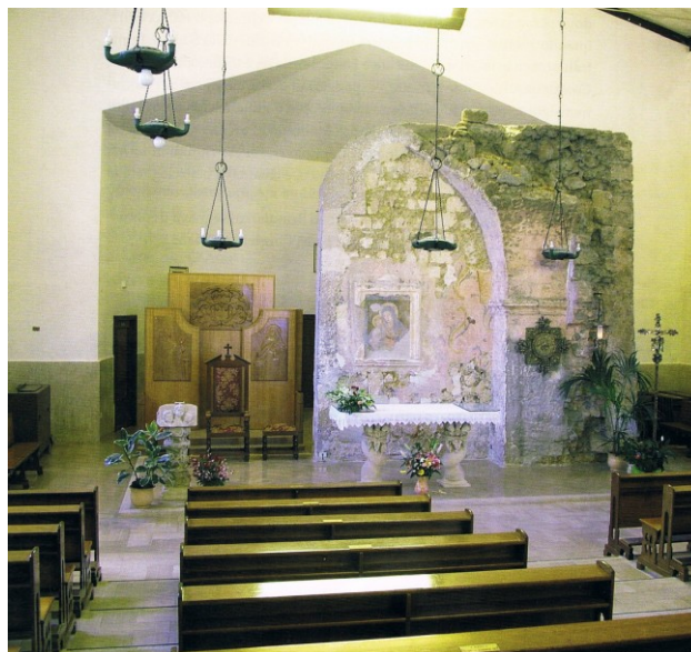
Interno del Santuario nel quale è stato incorporato il vecchio muro